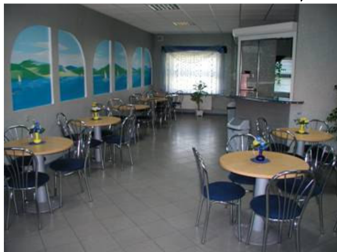
Kawiarenka serwis kawowy – 1 osoba/10 zł