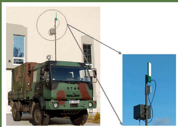
Rys. 1. Przykładowe rozwinięcie elementów PDB na wysięgniku aparatuwni

System jest prosty w budowie, przez co umożliwia łatwe i szybkie rozwinięcie oraz konfigurację.