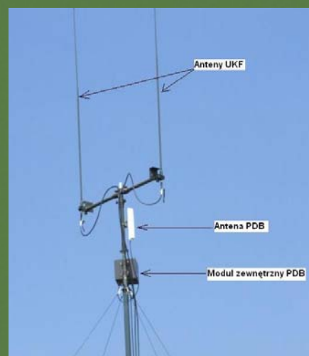
Rys. 2. Przykładowe rozwinięcie elementów PDB na maszcie (w tym wypadku zastosowano maszt Wozu Dostępu Radiowego)

PDB został opracowany zgodnie z zasadą COTS – czyli z wykorzystaniem urządzeń komercyjnych spełniających potrzeby i wymagania wojskowe. Podstawowa modyfikacja w stosunku do rozwiązań cywilnych polegała na rozszerzeniu o możliwość pracy w zharmonizowanym pasmie NATO 4,4 GHz oprócz standardowej pracy w pasmie komercyjnym (2,4 GHz).